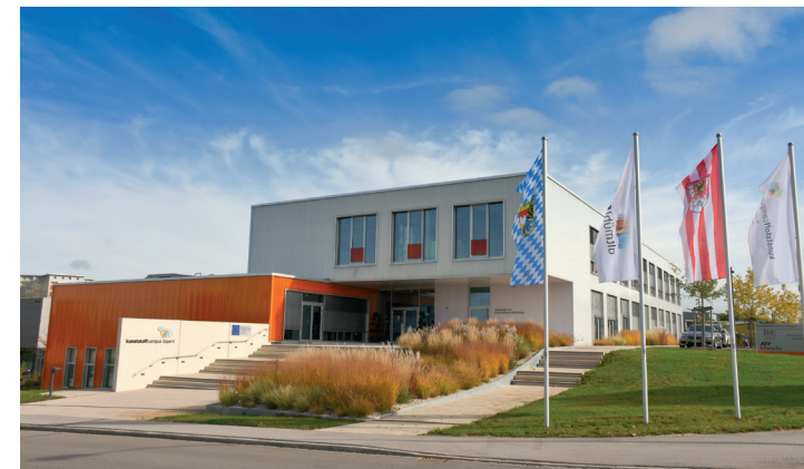
kunststoffcampus bayern - Technologie- und Studienzentrum Weißenburg, Richard-Stücklen-Straße 3

Ein berufsbegleitendes Studium am Campus Weißenburg ist eine Möglichkeit, mit der Sicherheit und dem Einkommen eines festen Jobs, bereits erworbene Qualifikationen zu verbessern und neue Schritte auf der Karriereleiter anzustreben. Mit diesen besonderen Kenntnissen werden die Absolventen in die Lage versetzt, innovativ tätig zu sein, den Transformationsprozess zu einer nachhaltigen Zukunft zu gestalten und damit die Wettbewerbsfähigkeit der Kunststoffindustrie zu stärken.