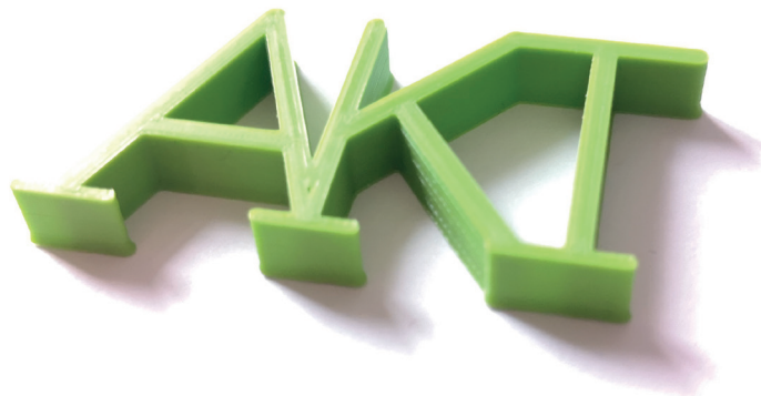
3D-Druck des AKT-Logos aus einem Biokunststoff

Ingenieurwissenschaftliche und betriebswirtschaftliche Grundlagen werden ergänzt mit Modulen zur Persönlichkeitsentwicklung und Profilmodulen, die Spezialkenntnisse aus dem Kunststoffbereich beinhalten. Beispielsweise werden in den Modulen Prototyping und Design, Simulationstechnik oder Oberflächentechnik Spezialkenntnisse, wie sie in der modernen kunststoffverarbeitenden Industrie stark nachgefragt werden, vermittelt. Die Lehrinhalte haben einen starken Anwendungsbezug und werden mit Projekt- und Praxisarbeiten vertieft.