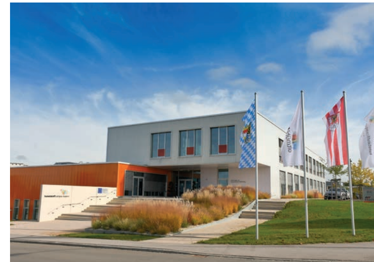
kunststoffcampus bayern - Technologie- und Studienzentrum Weißenburg, Richard-Stücklen-Str. 3

Ein berufsbegleitendes Studium am Campus Weißenburg – direkt in der Region – ist eine Möglichkeit, mit der Sicherheit und dem Einkommen eines festen Jobs, bereits erworbene Qualifikationen zu verbessern und neue Schritte auf der Karriereleiter anzustreben.