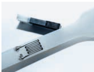
Integrierte 3D-gedruckte Sensoren