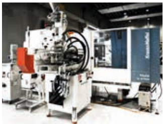
2K Spritzgießmaschine mit Spritzdruck von 2500 bar

Beispiele wie elektroaktive Polymerfolien mit sensorischen und aktuatorischen Funktionen, elektrische Isolationsmaterialien und Compounds, Funktionsfilamente für den 3D-Druck, strukturintegrierte Energiespeicher mit dynamischen Eigenschaften wie lasttragende Batteriezellwände, Schwingungsreduktion, Lastpfadumleitung im Schadensfall, Stabilitätsbeibehaltung und -erhöhung via strukturintegrierter Sensoren sowie Aktuatoren und Regelung resultieren in der Funktionserweiterung von Bauteilen und Bauteilsystemen.