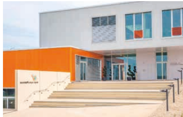
Aussenansicht TZ Weissenburg