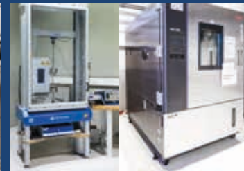
Zugprüfmaschine und Klimakammer